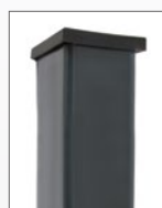
Zaunpfahl 60 x 40 mm