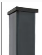
Zaunpfahl 60 x 40 mm