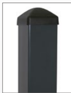
Zaunpfahl 40 x 40 mm